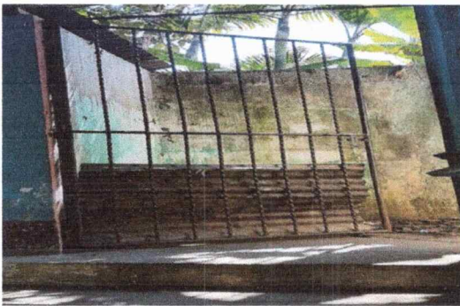
Foto 5: PORTON EN MAL ESTADO YA SE LE CAYO UN AGARRADOR QUE LO SOSTIENE EN LA PARED.