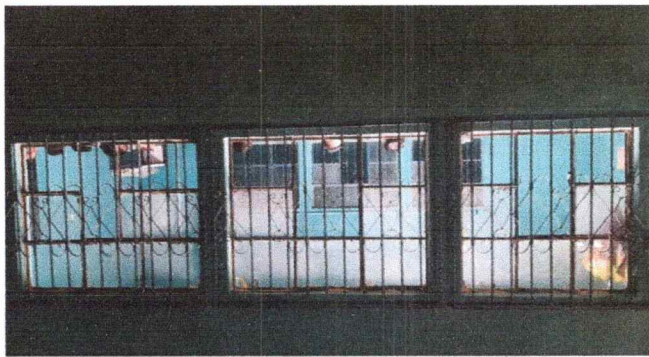
Foto 1: SE PUEDE VER QUE LOS VIDRIOS ESTAN QUEBRADOS DE AMBOS LADOS DEL AULA