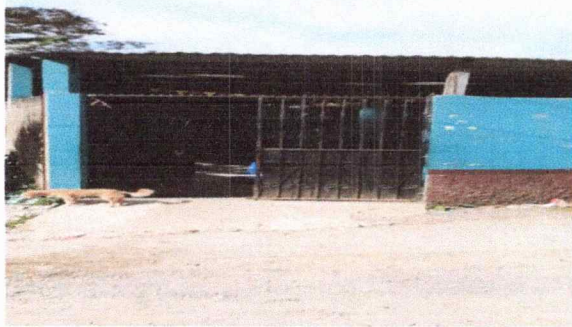
Foto 3: EL PORTON YA ESTA EN MAL ESTADO TIENE QUEBRADOS SUS GANCHOS Y YA CUESTA DEMASIADO ABRIRLO