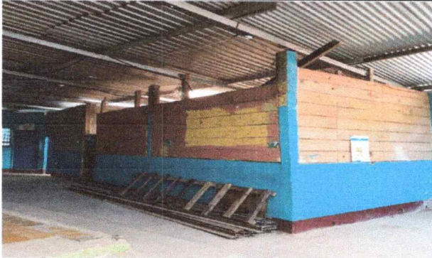
Foto1: EN ESTA FOTO SE PUEDE VER QUE ESTA AULA NO TIENE VENTANAS NI UNA PUERTA SEGURA.